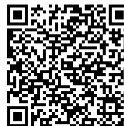
Datenschutzinformationen für die Teilnahme an Großveranstaltungen nach Art. 13 DSGVO