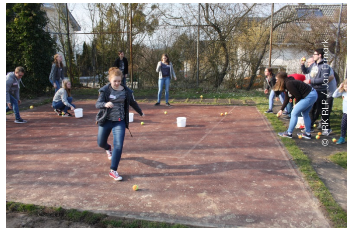
Geschafft – Bildungsurlaub beantragt, genehmigt. Herzlich Willkommen aufm Gruppenleiterseminar! Herausgegeben vom LV RLP.

„Bildungsurlaub“ heißt eigentlich „Bildungsfreistellung“ und bedeutet, dass ihr extra Urlaubstage für die Teilnahme an Seminaren oder Veranstaltungen für gesellschaftspolitische u/o berufliche Weiterbildung bekommt.